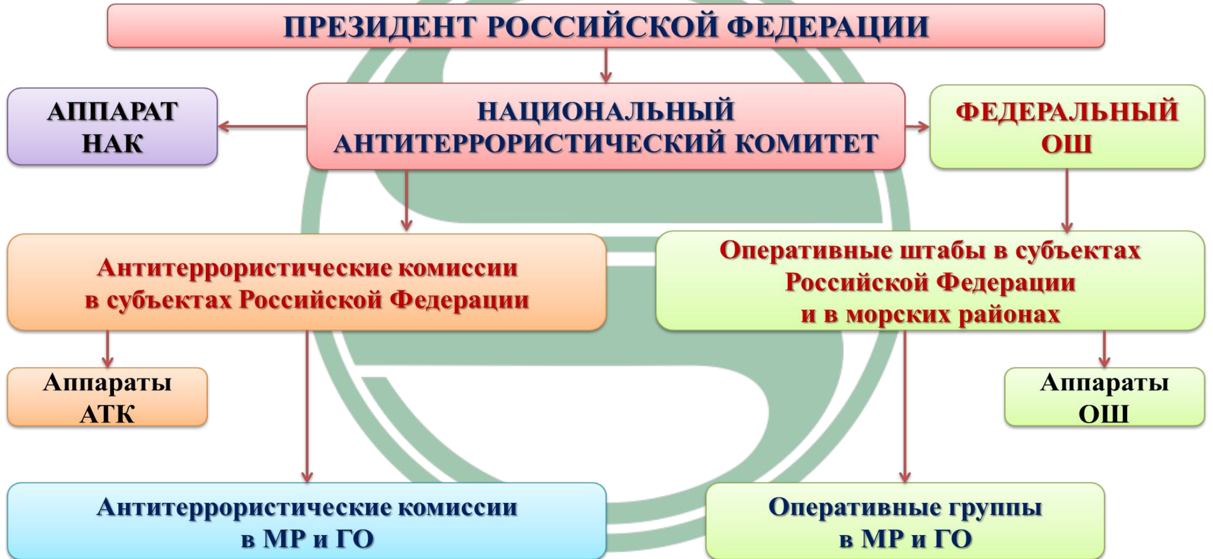
Схема координации деятельности по противодействию экстремизму и терроризму в РФ